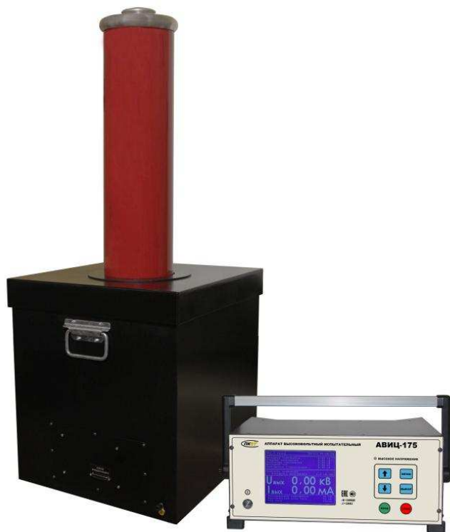
Рис. 1. Внешний вид аппарата АВИЦ-175.

Аппарат АВИЦ-175 представляет собой переносной прибор, состоящий из двух блоков, высоковольтного и управления, которые соединены между собой кабелем. Внешний вид аппарата приведён на рис. 1.